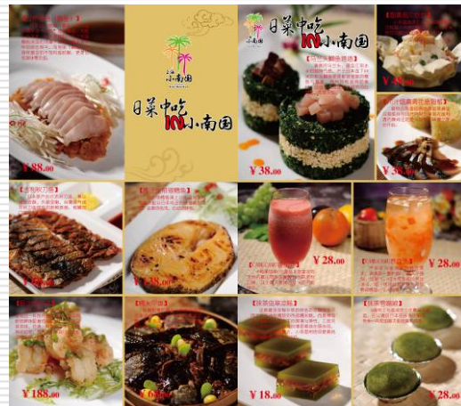
「日菜中吃IN小南国」特別メニュー表