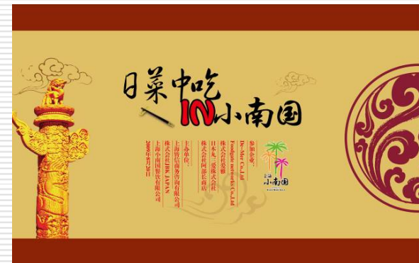
(上) 「日菜中吃IN小南国」メイン看板 (左) 「日菜中吃IN小南国」参加企業紹介バナー看板